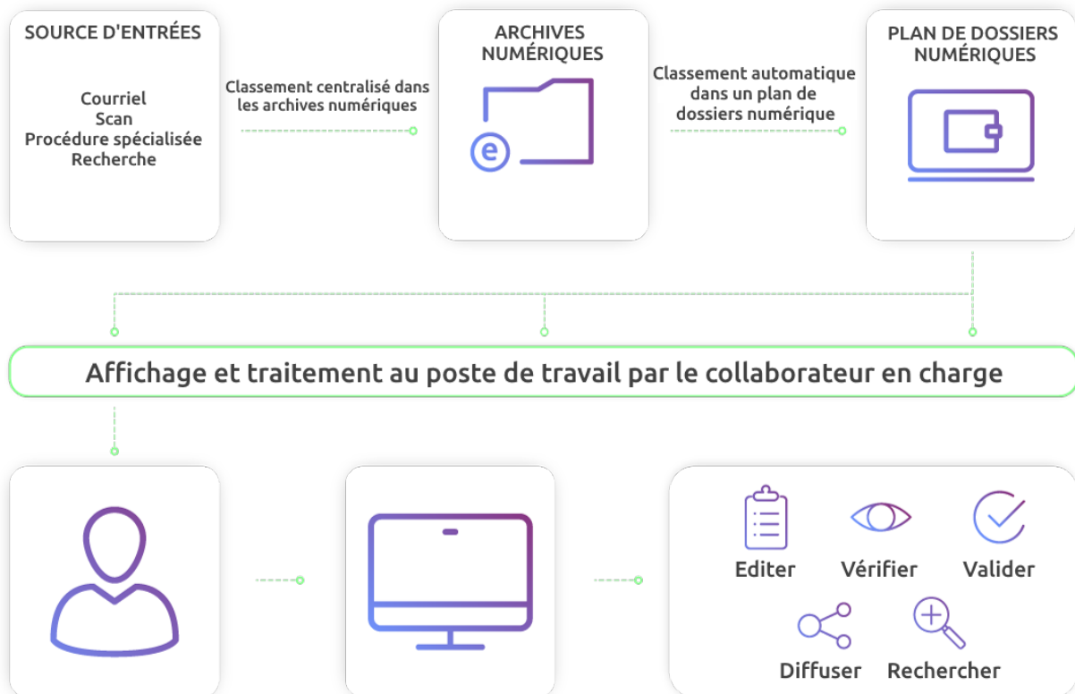
Le principe des dossiers numériques